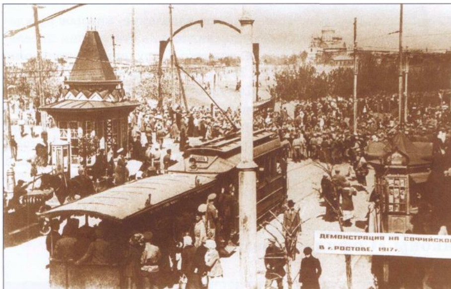
Демонстрация на Софийской площади. На горизонте видны силуэты Софийского храма. 1917 г.

В 1904 году взамен деревянной закладывается новый монументальный пятиглавый Софийский храм. Авторство проекта приписывается ростовскому архитектору В. В. Попову. Церковь была освящена в 1912 году.